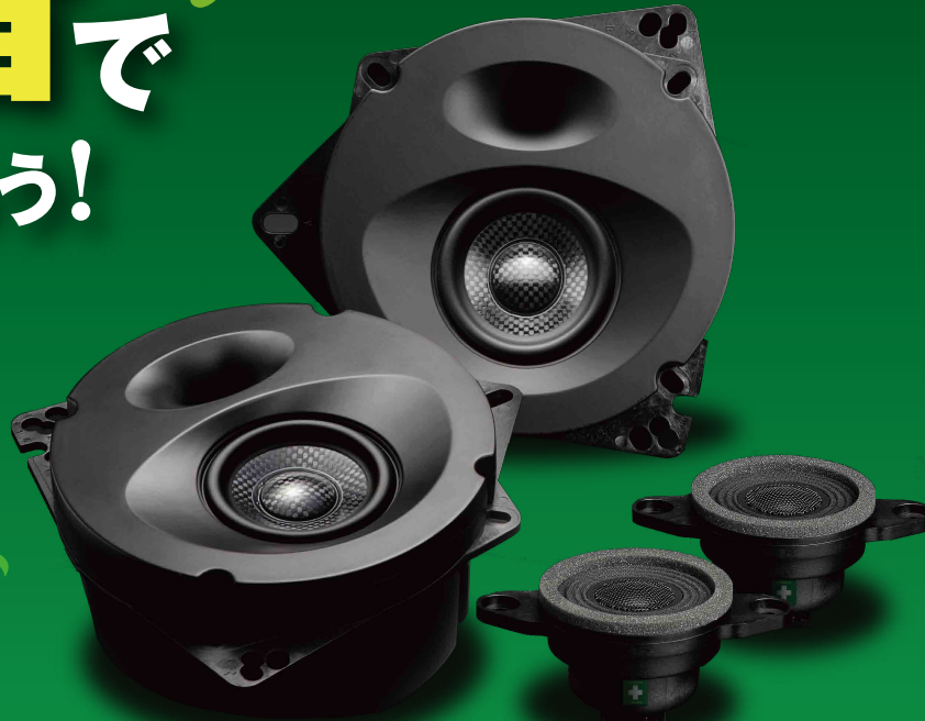
▲画像はRAV4(50系)専用ハイグレードモデル

ソニックデザインからの新提案!「ソニックプラス」は、 簡単・確実な取り付けでクリアなサウンドを実現し、 音漏れも解消できる、車種別専用設計の スピーカーパッケージです。