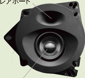
独自設計高性能スピーカー